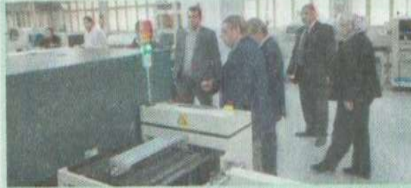
مجلس إدارة الشعبة العامة في زيارة لمصنع الإلكترونيات التابع للهيئة العربية للتصنيع