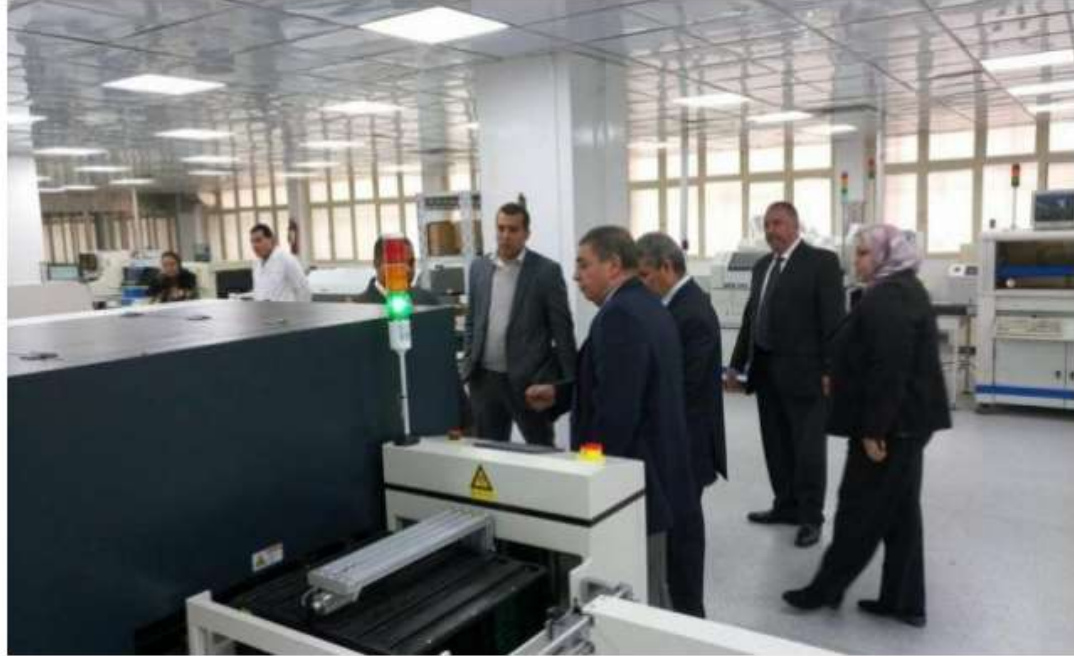
الاقتصاد الرقمي تبحث التعاون مع إلكترونيات العربية للتصنيع

تامر إمام | © السبت، 23 ديسمبر 2017 - 12:34 م