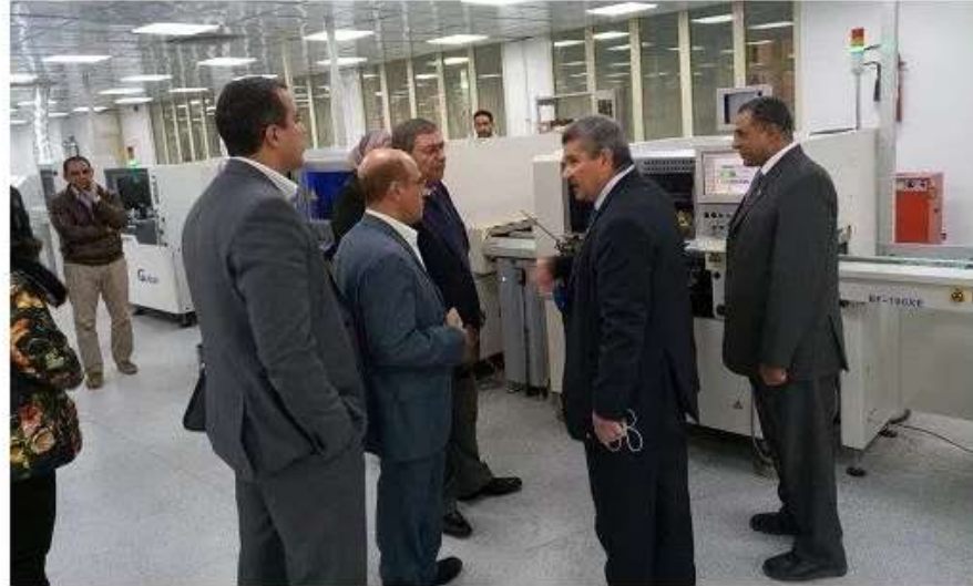
شعبة الاقتصاد الرقمي تبحث التعاون مع مصنع الإلكترونيات بالهيئة العربية للتصنيع