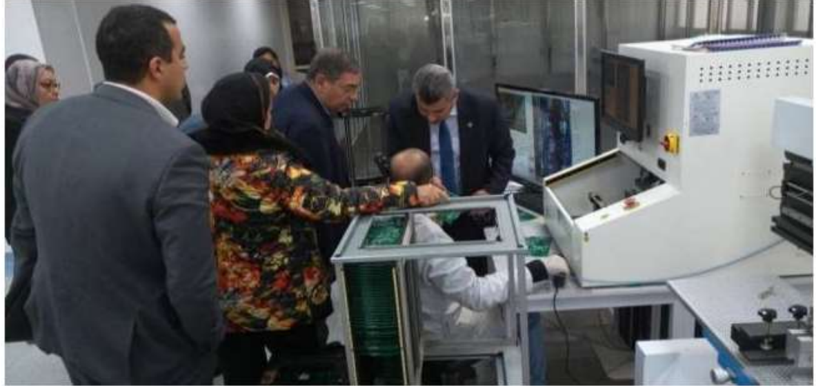
اثناء زيارة المصنع